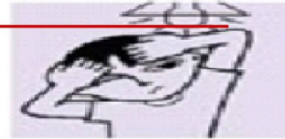
Dislike of bright lights Unusual in young children