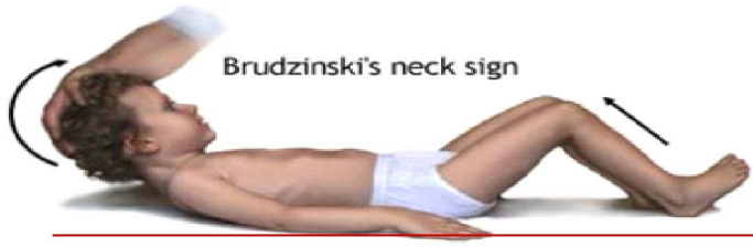
Brudzinski's neck sign