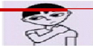
Stiff neck Unusual in young children